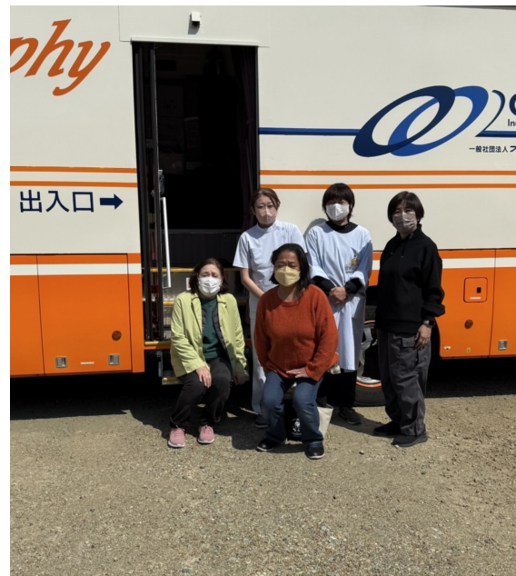
時間予約制で全員ではありませんが、検診バスの前にて。

民商婦人部と共済会は、業者婦人の健康の為にできることがないか、これからも企画を検討していきます。よろしくお願いします。